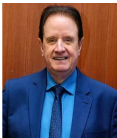
Adm. Samuel Albernaz Presidente CRAGO

Neste novo ano, vamos continuar trabalhando juntos para alcançar novos patamares de excelência e contribuir de forma significativa para o desenvolvimento econômico e social do nosso estado e do nosso país. Conto com a participação e o empenho de cada um de vocês para tornar 2024 um ano ainda mais brilhante para a administração em Goiás.